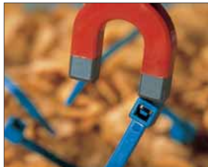
Die MCT-Kabelbinder enthalten Metallanteile.