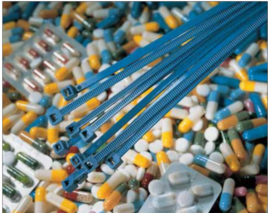
Sicherer und sauberer Produktionsprozess mit Kabelbindern der MCT-Serie.

MCT-Kabelbinder sind besonders geeignet für die Anwendung in der pharmazeutischen und chemischen Industrie sowie in der Lebensmittel- und Tierfutterproduktion. Die Kabelbinder eignen sich für das Verschließen von Transportbehältern, Gebinden und Säcken. Des Weiteren dienen die MCT-Binder zur Installation von Kabeln und Leitungen an Produktionsanlagen.